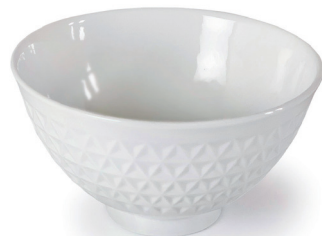
ASANOHA (ホワイト) 〈CH-W-01〉

精緻なデザインが特徴の JAPAN 器 MADE シリーズの茶碗。 お米の白さが際立つ色味と 手に馴染むサイズ感。 毎日使うものだからこそ 長く使えるものを。