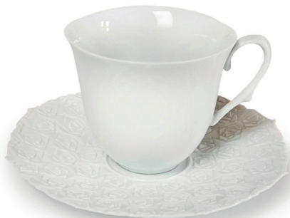
ROSE (ホワイト) 〈CS-W-02〉