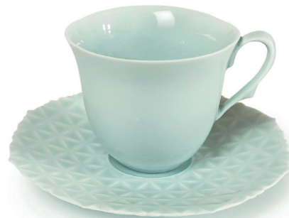
ASANOHA (ペイルブルー) 〈CS-PB-01〉