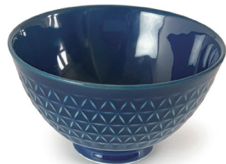
ASANOHA (ヴァンテージネイビー) 〈CH-VN-01〉