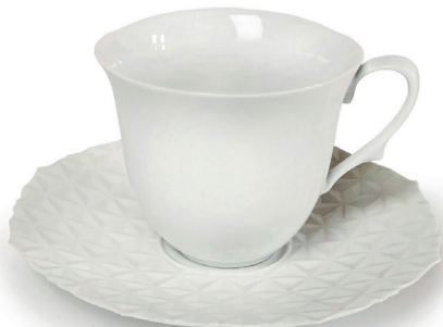
ASANOHA (ホワイト) 〈CS-W-01〉