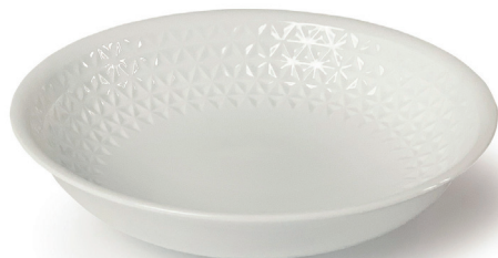
ASANOHA (ホワイト) 〈RD-W-01〉

パスタやスープ、カレー皿としてなど幅広くお使いいただける 浅めのボールタイプのディッシュです。 使いやすいサイズ感で普段使いにもおすすめです。