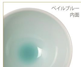
ペイルブルー 内面