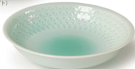
ASANOHA (ペイルブルー) 〈RD-PB-01〉