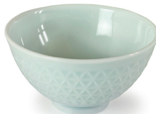
ASANOHA (ペイルブルー) 〈CH-PB-01〉