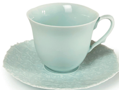
ROSE (ペイルブルー) 〈CS-PB-02〉