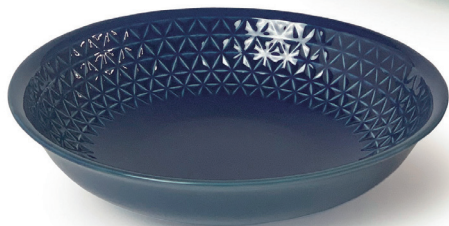
ASANOHA (ヴァンテージネイビー) 〈RD-VN-01〉